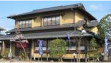
こだわりとんかつ ねぼけ 本店